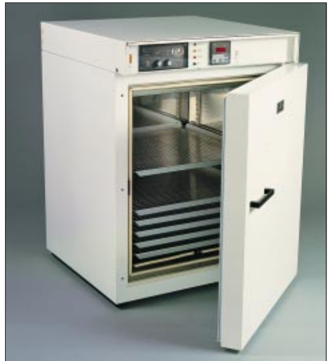
EL78-4200/01 150 升保湿箱