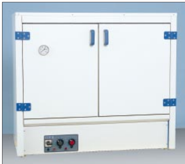
EL78-0110/01 225 升烘箱及配件